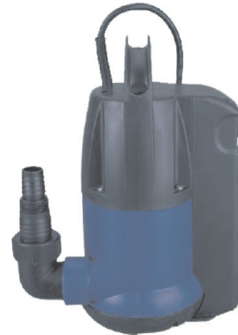
AT-Tauchpumpe clear water 250W Art.-Nr.: AT 001 005 001